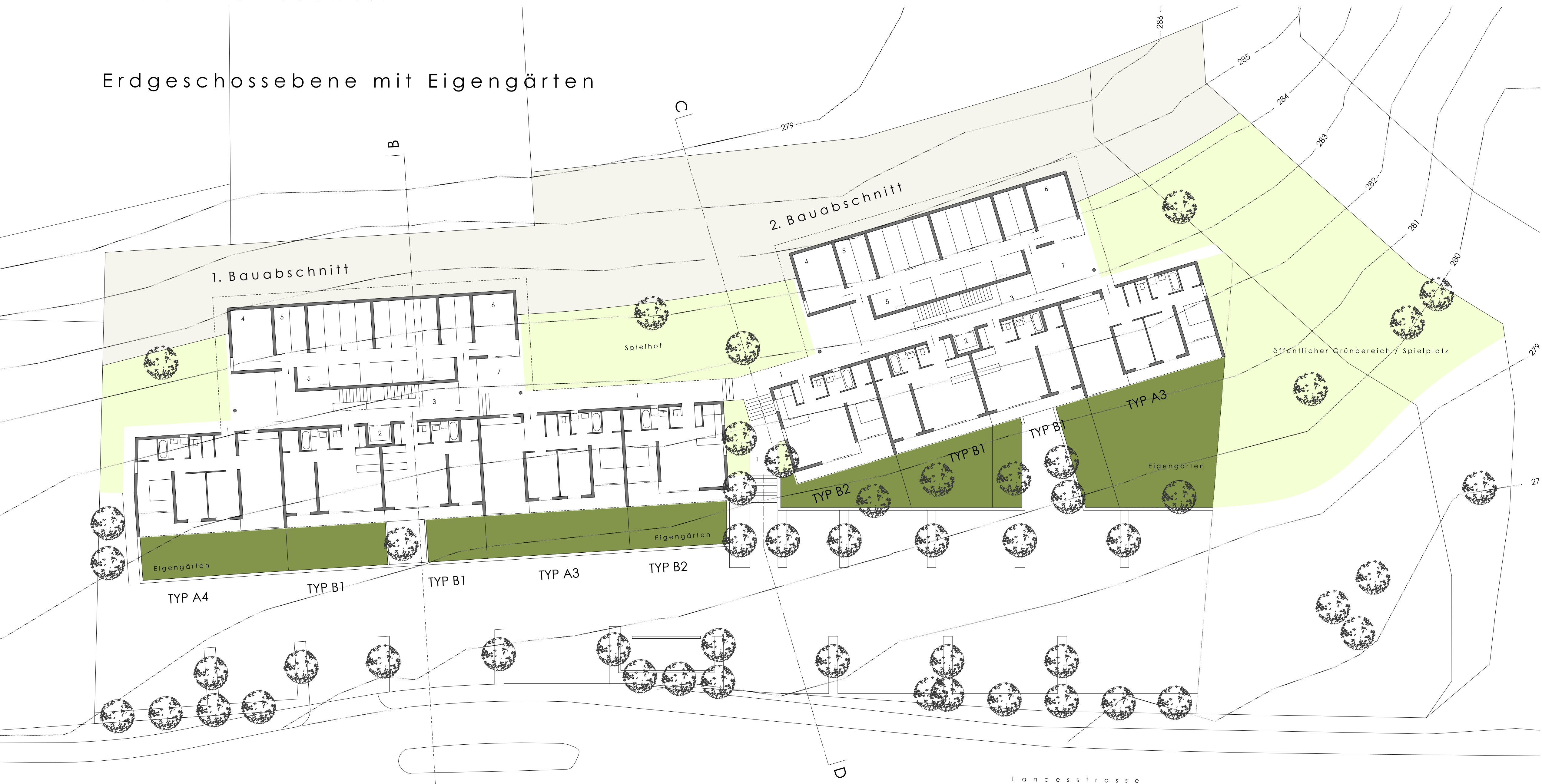
Erdgeschosssebene mit Eigengärten